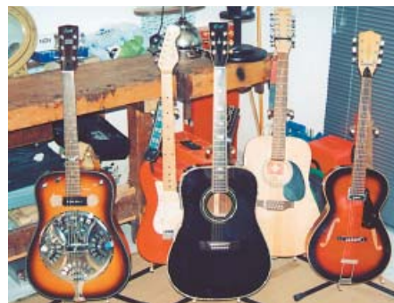
kein zweites Mal gibt.

Mit einem Prototyp ausgerüstet trete ich also an diesen «Songtagen» in der Matte-Rock Beiz mit einem groovigen Kurzprogramm auf. Der Erfolg ist verblüffend und ich werde auch schon zur Neueröffnung von «Albi's Mountain-Rock-Café» engagiert. Ich nehme an und spiele dort nach vielen Band-Jahren zum ersten mal wieder ein volles