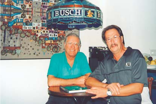
Auch in der Küche bei Vescolis ist der gemütlichste Platz