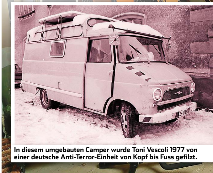
In diesem umgebauten Camper wurde Toni Vescoli 1977 von einer deutsche Anti-Terror-Einheit von Kopf bis Fuss gefilzt.

T oni Vescoli (72) kann keiner Fliege etwas zu leide tun. Einmal aber geriet der «Schweizer Beatle» ins Visier einer deutschen Anti-Terror-Einheit. «Die Männer hatten Schusswesten und die Finger am Abzug.»